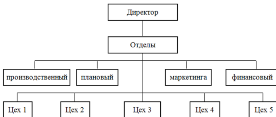
Рис.3 Линейно-Функциональный тип организационной структуры